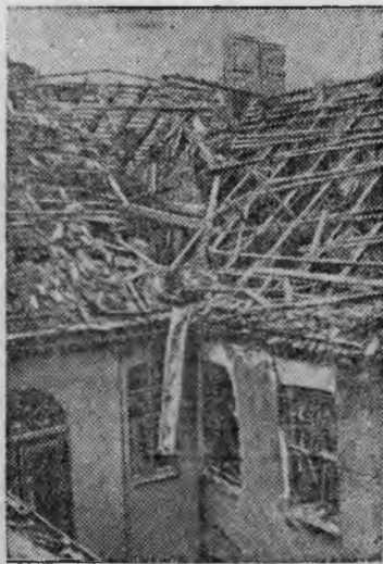
Жилой дом на Риттерштрассе, разрушенный в результате бомбардировки.

Бомбардировка Берлина английской авиацией.